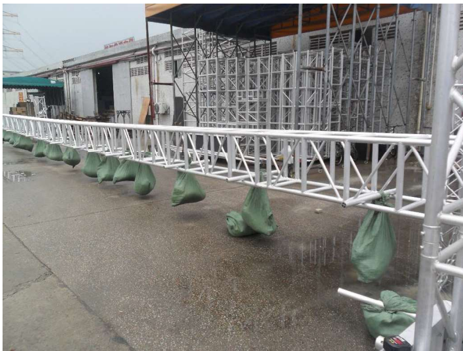
CS5060 (in testing)