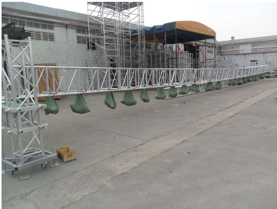
CS6076 (in testing)